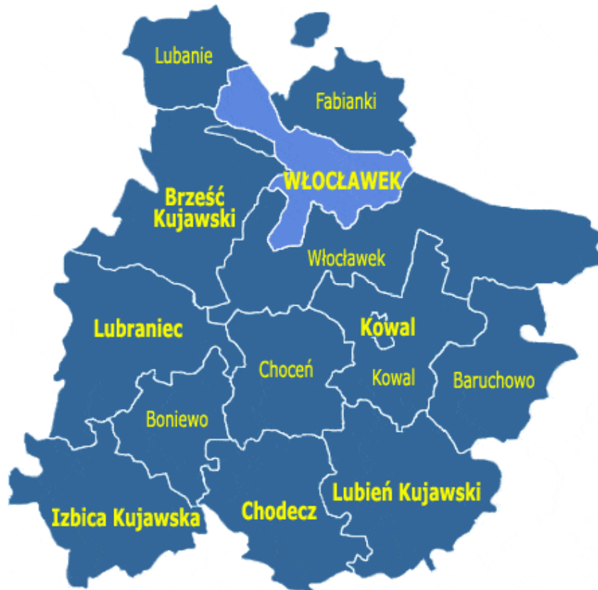
Rysunek 1. Położenie Gminy Chocień w powiecie włocławskim

Gmina położona jest w północnej części województwa kujawsko-pomorskiego. Gmina graniczy: z gminami – Boniewo, Chodecz, Kowal, Lubień Kujawski, Lubraniec, Włocławek