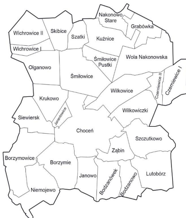
Rysunek. Podział Gminy na sołectwa