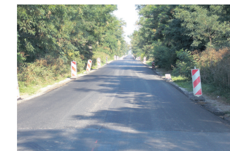
poszerzenie jezdni - dr. Krukowo-Olganowo