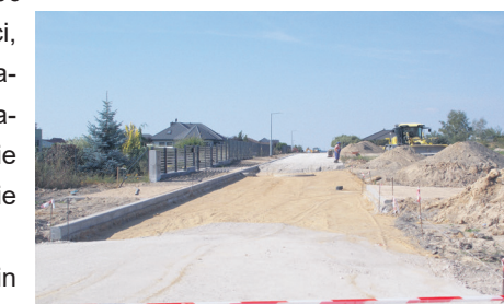
ul. Akacyjowa 1