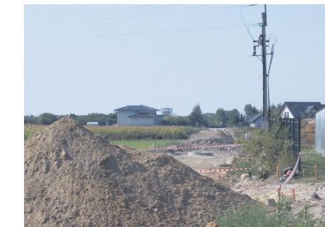
ul. Łąkowa - c.d. kanalizacja deszczowa