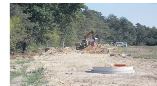
ul. Łąkowa -kanalizacja deszczowa