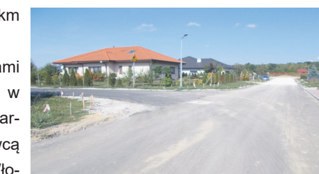
skrzyżowanie ul. Dębowa i Klonowa