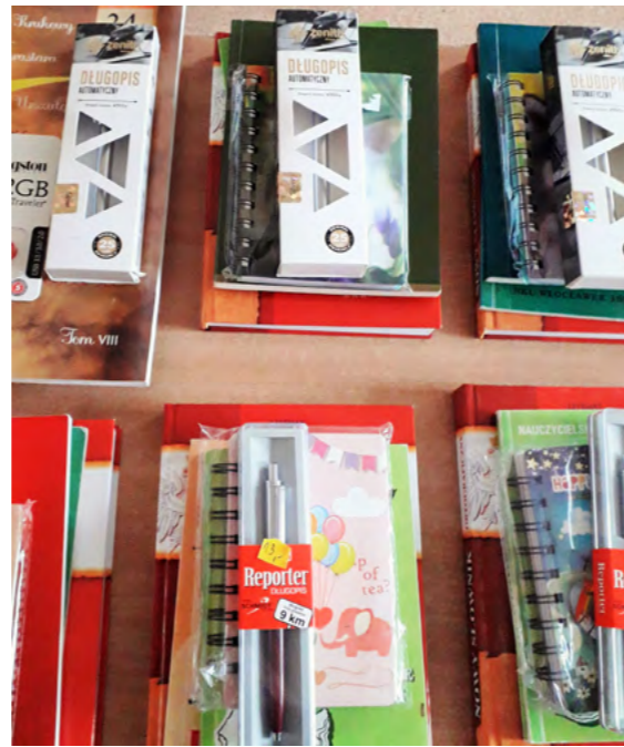
Zespół Szkół Samochodowymich. Tadeusza Kościuszki we Włocławku